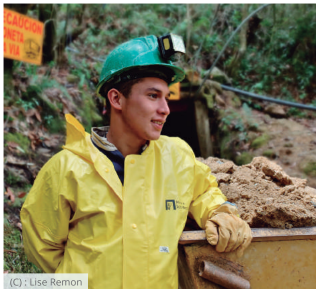
(C) : Lise Remon

Muchos líderes de la industria han expresado su interés en contribuir con el desarrollo social y económico en AARACs a través de suministro responsable de minerales , y permitiendo un al sector MAPE un desempeño mejorado . Aún así, un mecanismo eficiente y estandarizado, combinado con la capacidad de construcción del sector, es necesario para el manejo viable de los riesgos asociados a comprar de la MAPE.